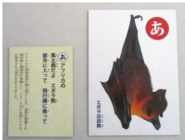
▲小学生向け読み札(左)と絵札(右)。

感染症は日常生活のなかで、誰でも罹患する可能性があり、知識がないために重症化させ、命を落とすこともあります。当院では、広く市民の皆さまにも感染症について知っていただきたいと考え、著者である岡田晴恵先生のご理解・ご承諾と、発売元の奥野かるた店の協力を得て、「感染症カルタ」発売後、国内で初めての展示会を、当院で開催する運びとなりました。カルタの現物を用いて、絵札、解説札、小学生向け読み札、医療職向け読み札を、50音順に展示いたします。期間中は、診療時間内ならば、どなた様もご覧になれます。